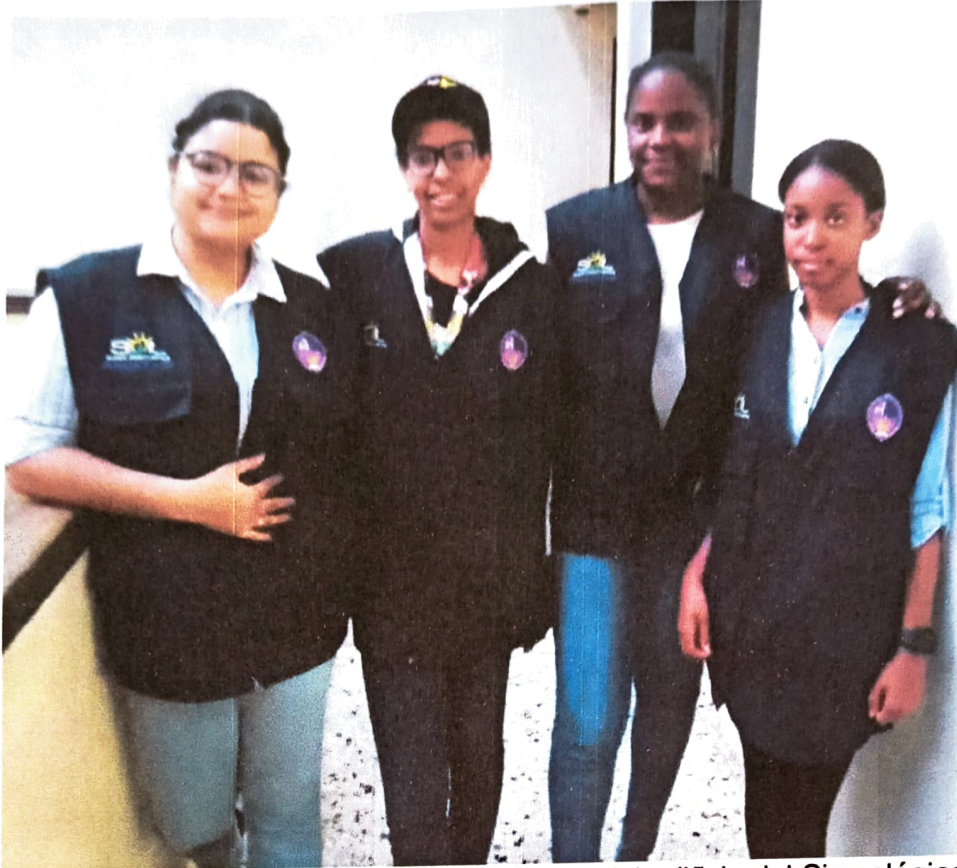
Jornada de embellecimiento ambiental en el entorno del edificio del Sismológico.

"Año de la Internacionalización y Resiliencia Universitaria"