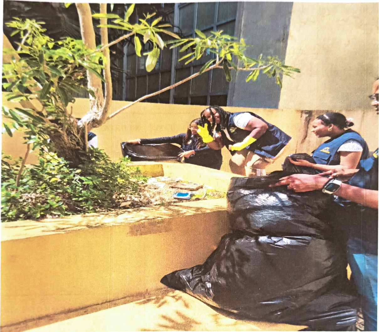
SOL. Jornada de embellecimiento ambiental en el entorno del edificio del Sismológico. PROGRAMA SOL EN EL CAMPUS UNIVERSITARIO:

"Año de la Internacionalización y Resiliencia Universitaria"