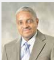
FRANCISCO VEGAZO INVESTIGACION Y POSTGRADO