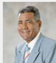
FCO. TERRERO GALARZA EXTENSION