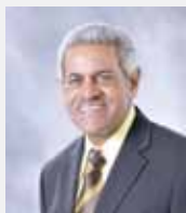
MODESTO REYES VALENTIN VETERINARIA Y AGRONOMICA