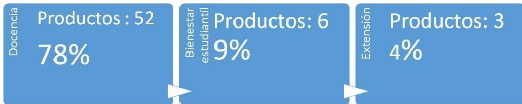
Figura 4: Porcentaje de Productos en los 3 programas más importantes

El POA 2021 está compuesto por 67 productos, distribuido en 9 programas, de los cuales como ya se dijo anteriormente se evalúan dos (Docencia y Bienestar estudiantil), lo que representa un 85% de los productos programados. De estos productos, el 78% corresponde al programa de docencia y mejora de la misma, mientras que el 9% y el 4% a Bienestar estudiantil y Extensión respectivamente. Los demás productos se relacionan con los 6 programas restantes.