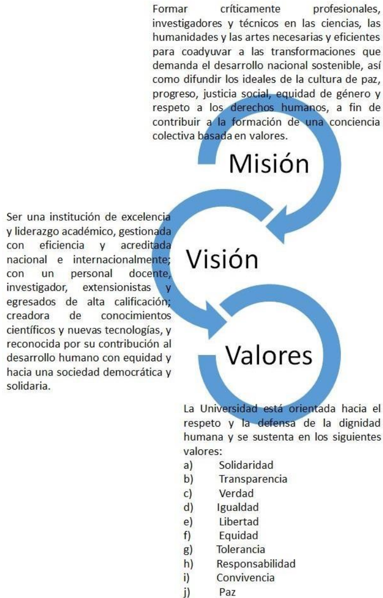
Figura 1 Misión, Visión, Valores Institucionales de la UASD