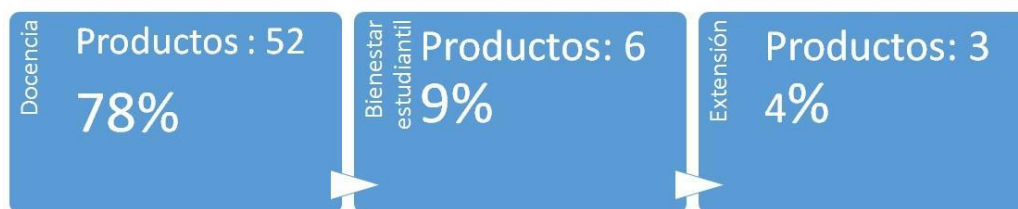
Figura 3: Porcentaje de Productos en los 3 programas más importantes

El POA 2020 está compuesto por 67 productos, distribuido en los 9 programas, citados anteriormente, de los cuales como ya se dijo se evalúan dos (Docencia y Bienestar estudiantil, lo que representa un 85% de los productos programados. De estos productos, el 78% corresponde al programa de docencia y mejora de la misma, mientras que el 9% y el 4% a Bienestar estudiantil y Extensión respectivamente. Los demás productos se relacionan con los 6 programas restantes.