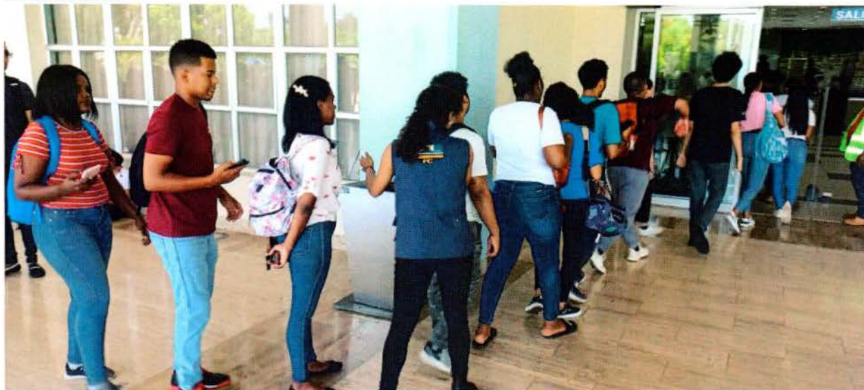
Entregas de Tablet a estudiantes y docentes en la biblioteca Pedro Mir.