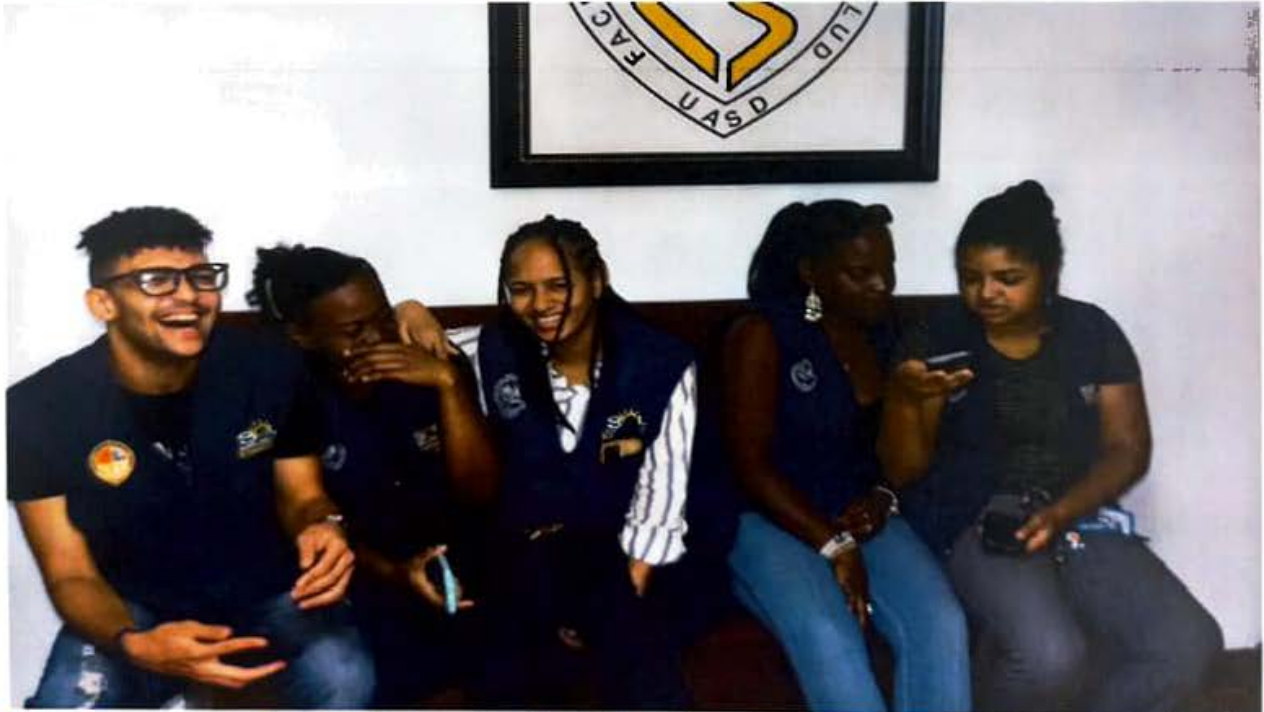
En el dispensario Médico: Prevención de ruidos, desorden y basuras; induciendo el Silencio, el Orden y la Limpieza.