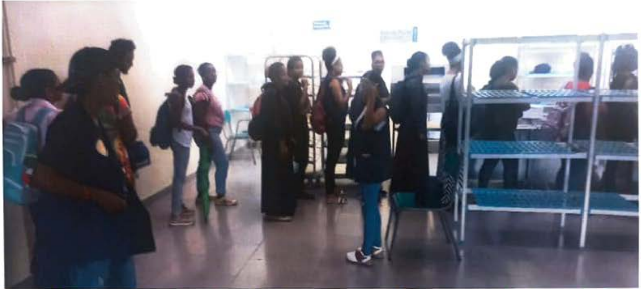
Comedor universitario: Soporte en el orden, verificación de los y las estudiantes y en entrega de ticket