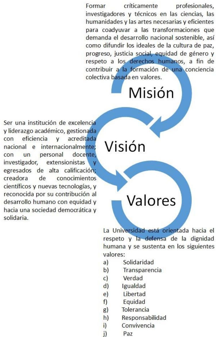
Figura 1 Misión, Visión, Valores Institucionales de la UASD